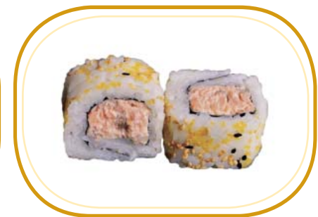
108. MIURA €8,00 (riso aceto, alghe, salmone grigliato, philadelphia, tobiko* esterno, salsa teriyaki, sesamo)