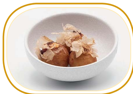
157. TAKOYAKI (3pz) €5,00 (polpettine fritte di polpo* con salsa teriyaki,maionese)