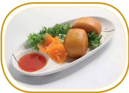
165. PANE* FRITTO €3,00