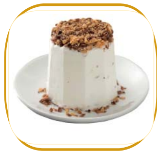
SEMIFREDDO AL TORRONCINO €4,50