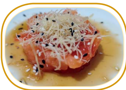
16. TARTARE SALMONE SPICY KATAIFI €7,00 (cubetti salmone, sesamo, salsa ponzu, salsa sriracha, sopra kataifi)