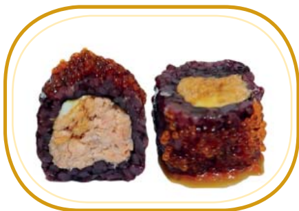
142. BLACK MIURA €8,00 (riso venere alghe, salmone grigliato, philadelphia, esterno tobiko, salsa teriyaki)