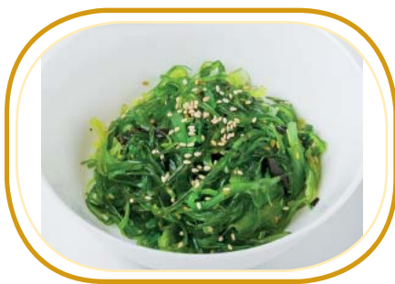
153. WAKAME €4,00 (alghe giapponese)