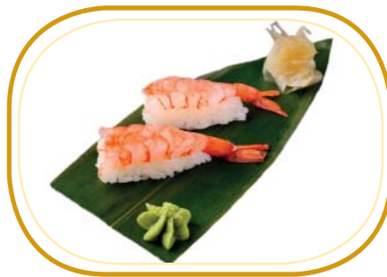
46. NIGIRI AMA EBI (gambero rosso*) €5,00