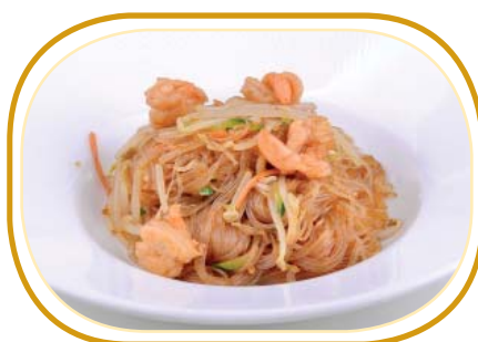
184. SPAGHETTI DI SOIA €5,90 (spaghetti di soia, verdure, gamberi*, uova)