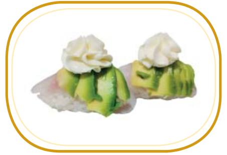
38. NIGIRI BRANZINO AVOCADO €4,00 (riso aceto,branzino,avocado,philadelphia)