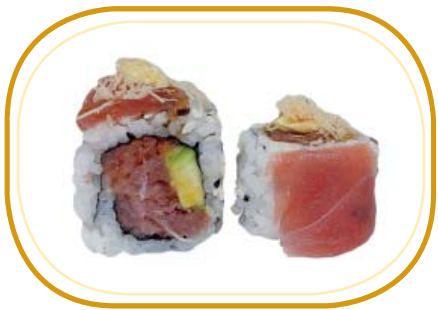
116. AMAZON €12,00 (riso aceto, alghe, tartare di tonno, avocado, philadelphia, tonno esterno, maionese, salsa teriyaki, kataifi, sesamo)