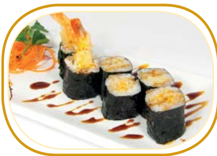
83. HOSOMAKI EBITEN €3,00 (riso aceto alghe,gamberi* in tempura, salsa teriyaki)