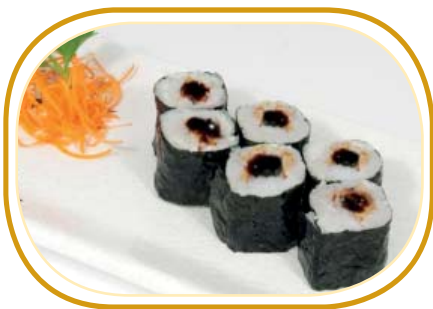
82. HOSOMAKI ANGUILLA* €4,50 (riso aceto alghe,anguilla,salsa teriyaki)