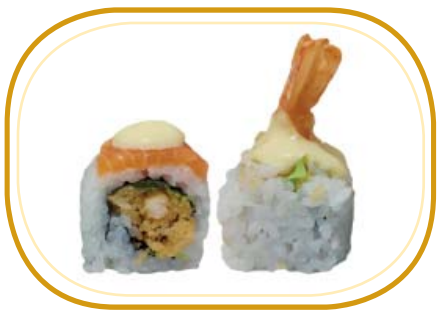
119. LEMON ROLL €12,00 (riso aceto, alghe, gambero* fritto, insalata, salmone esterno, salsa limone, sesamo)