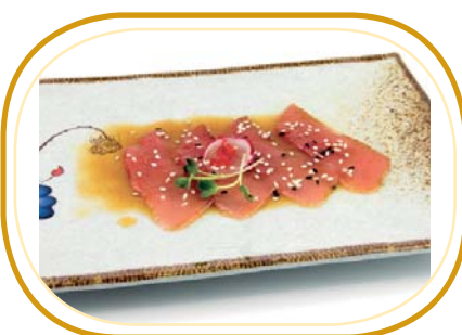
8. CARPACCIO TONNO €4,00 (tonno,sesamo e salsa ponzu)