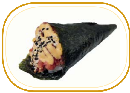
76. SPICY TUNA TEMAKI €5,00 (riso aceto, alghe, cubetti tonno, avocado, sesamo, salsa spicy)