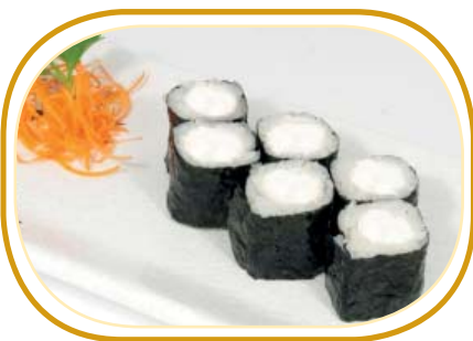
88. HOSOMAKI PHILADELPHIA €3,00 (riso aceto alghe,philadelphia)