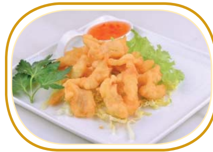
229. TEMPURA POLLO €6,00 (bocconcini di pollo impanati fritti)