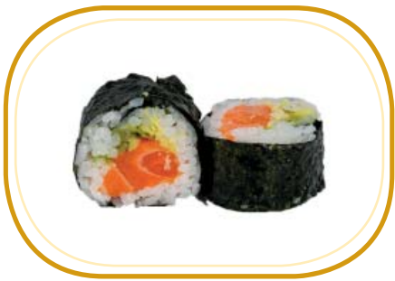
90. FUTOMAKI SALMONE €10,00 (riso aceto, alghe, salmone, avocado, maionese)