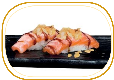
49. NIGIRI MANDORLE €5,00 (riso aceto, salmone scottato, salsa teriyaki e mandorle)