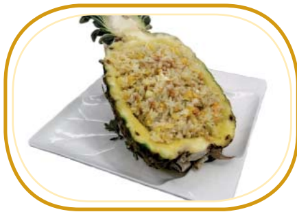
179. RISO ANANAS €7,00 (riso saltato con ananas, verdure, uova, pinoli)