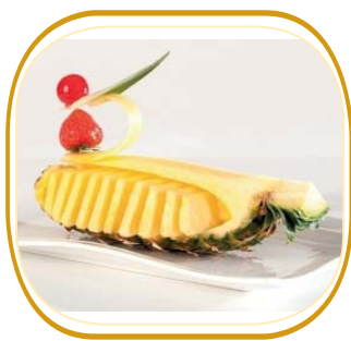
FRUTTA di STAGIONE (melone o ananas) € 3,50