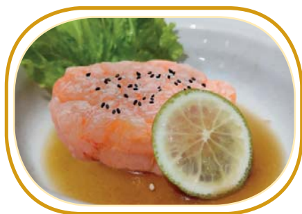
18. TARTARE GAMBERO ROSSO* €10,00 (cubetti gambero rosso*, sesamo e salsa ponzu)