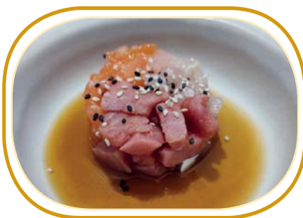
19. TARTARE MISTO €8,00 (cubetti pesce misto, sesamo e salsa ponzu)