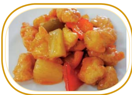
206. POLLO AGRODOLCE €6,50 (pollo fritto, pomodoro, ananas, salsa agrodolce)