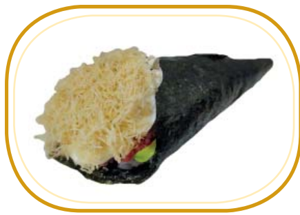
74. TONNO KATAIFI TEMAKI €5,00 (riso aceto, alghe, tartare di tonno, avocado, philadelphia, sesamo, kataifi)