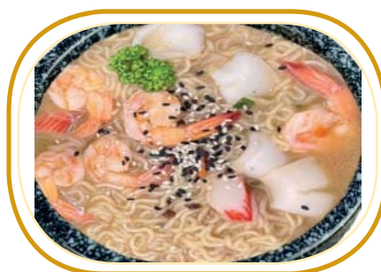
190. RAMEN CON FRUTTI MARE €8,00 (ramen con brodo, frutti di mare*, verdure)