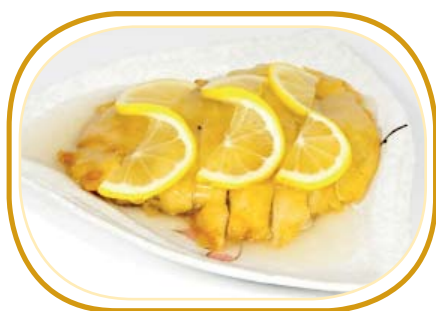
208. POLLO AL LIMONE €6,50 (fettina di pollo fritto con limone fresca)