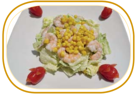
172. EBI INSALATA €5,00 (insalata, mais, gamberi *cotti, pomodoro, maionese)