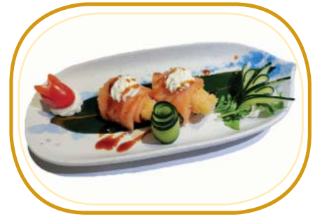
26. INVOLTINI EBITEN €5,00 (gambero* fritto, avvolto di salmone sopra philadelphia, salsa teriyaki)