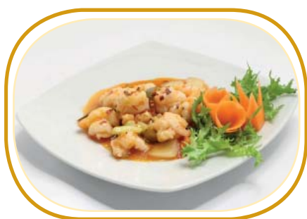
202. GAMBERI* PICCANTE €7,50 (gamberi, verdure, salsa piccante)