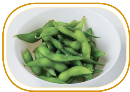
152. EDAMAME* €4,00 (fagiolini di soia al vapore)