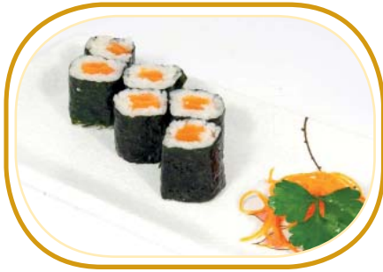
79. HOSOMAKI SALMONE €3,50 (riso aceto alghe,salmone)