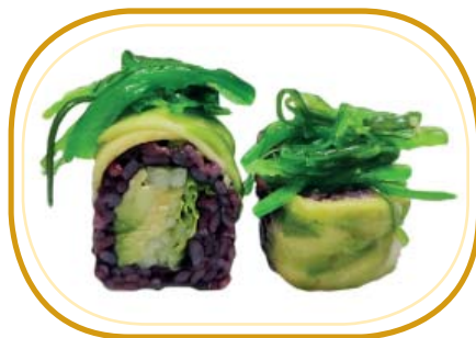
143. BLACK VEGETARIANO €8,00 (riso venere, cetriolo, insalata, esterno avocado, wakame, sesamo)