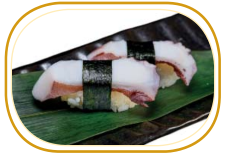
44. NIGIRI POLPO* €3,00