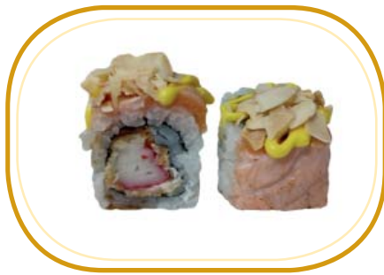
125. SURIMI ROLL €12,00 (riso aceto, alghe, polpa di granchio* fritto, philadelphia, salmone scottato esterno, mandorle, salsa flambé, salsa teriyaki, sesamo)