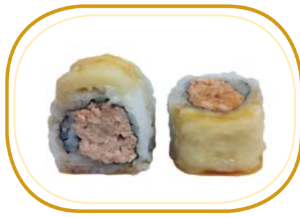
135. SCIMMIA ROLL €10,00 (riso aceto, alghe, salmone, grigliato, philadelphia, banana esterno, salsa teriyaki, sesamo)