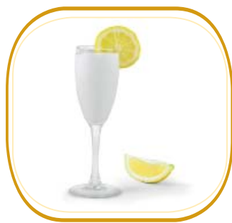
SORBETTO € 3,50