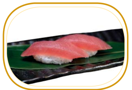
41. NIGIRI TONNO €4,00