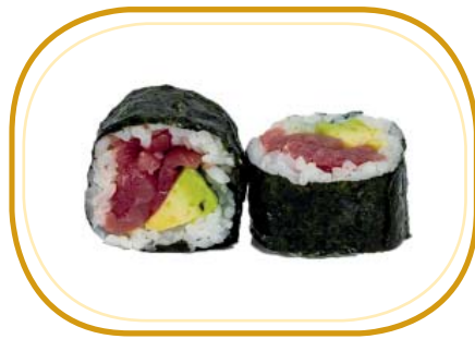
91. FUTOMAKI TONNO €10,00 (riso aceto, alghe, tonno, avocado, maionese)