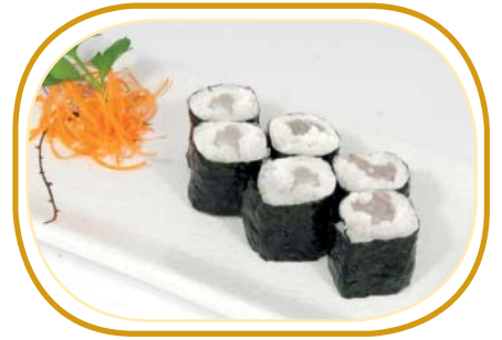
81. HOSOMAKI BRANZINO €3,50 (riso aceto alghe,branzino)