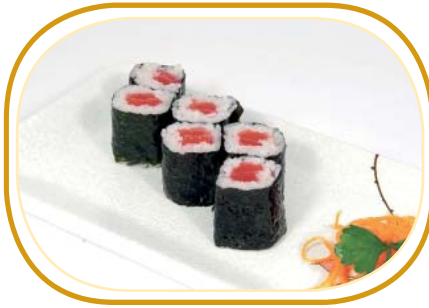
80. HOSOMAKI TONNO €4,00 (riso aceto alghe,tonno)