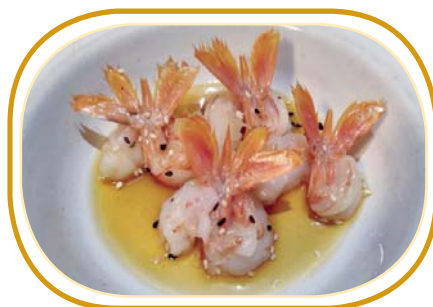
11. CARPACCIO AMA EBI €5,00 (gambero rosso, sesamo e salsa ponzu)