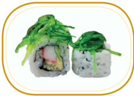
103. CALIFORNIA WAKAME €9,00 (riso aceto, alghe, polpa di granchio*, cetriolo, avocado, maionese, sesamo, wakame* esterno)