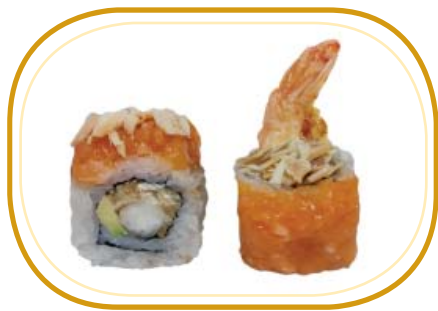
118. EBITEN FUSION ROLL €12,00 (riso aceto, alghe, gambero* fritto, avocado, philadelphia, tartare di salmone speziato esterno, mandorle, salsa teriyaki, sesamo)