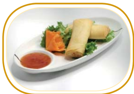
155. HARUMAKI (2pz) €2,00 (involtini con ripieno di verdure)