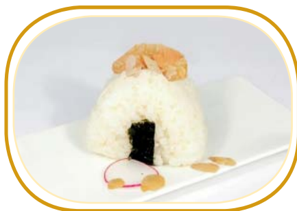
56. ONIGIRI MANDORLE €4,50 (tonno cotto, mandorle, salsa teriyaki)