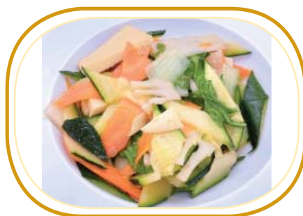
216. VERDURE MISTE SALTATE €4,50