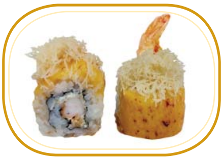
120. YELLOW CHEESE ROLL €12,00 (riso aceto, alghe, gambero* fritto, philadelphia, formaggio giallo esterno, kataifi, salsa teriyaki, sesamo)