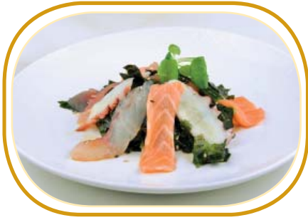
170. SUNOMONO €6,00 (alghe wakame essiccati, pesce misto, salsa carpaccio, sesamo)