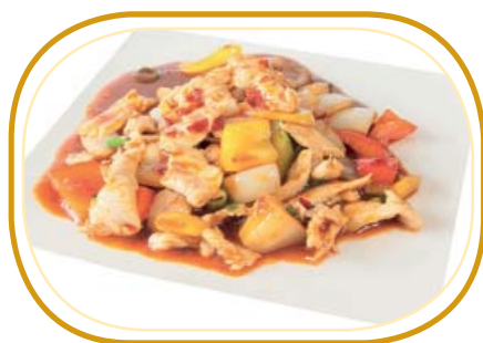
205. POLLO PICCANTE €6,50 (pollo, verdure, salsa piccante)