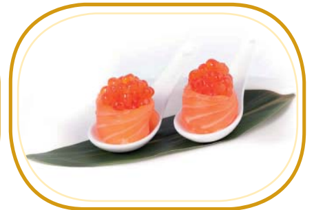
65. GUNKAN IKURA €5,00 (pochi riso aceto, avvolti salmone, guarniti con l'uova ikura)