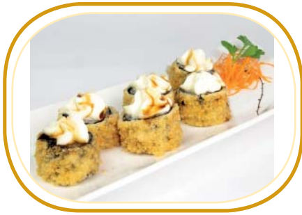
144. HOSSO FRITTO (6pz) €5,00 (riso aceto, alghe, salmone, philadelphia esterno, salsa teriyaki)