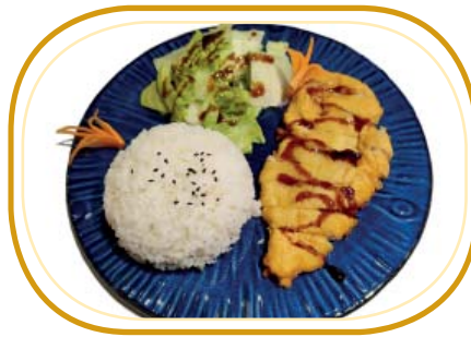
181. TORI TERIYAKI DON €8,00 (riso bianco, pollo impanato, insalata, salsa teriyaki)