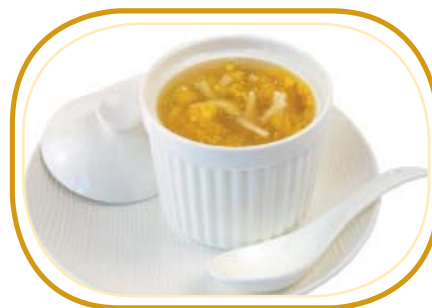
169. ZUPPA DI MAIS €4,50 (mais,pollo,uova)