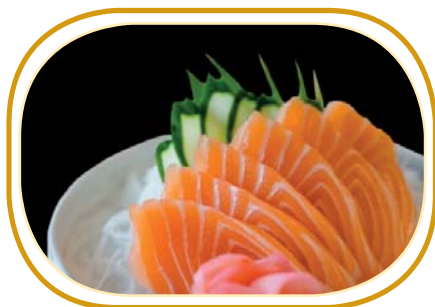
1. SALMONE SASHIMI(6pz)€6,00