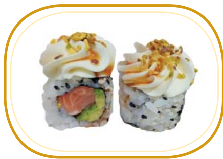
99. PISTACCHIO ROLL €10,00 (riso aceto, alghe, salmone, avocado, esterno, philadelphia, pistacchio, sesamo, salsa teriyaki)