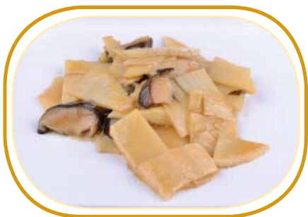
217. BAMBÙ E FUNGHI SALTATE €4,50