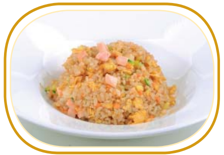
175. RISO THAI PICCANTE €5,50 (riso saltato, prosciutto, piselli, uova, mais, verdure, salsa piccante)