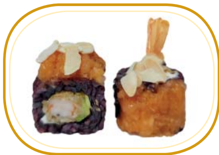
138. BLACK EBITEN FUSION €12,00 (riso venere alghe, gamberi* in tempura, philadelphia, esterno tartare di salmone speziato, mandorle, salsa teriyaki, sesamo)