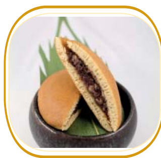
DORAYAKI (doppio pancake, cioccolato) € 4,50