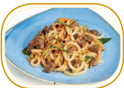
188. MANZO UDON €7,00 (spaghetti udon saltato, manzo, verdure, uova)