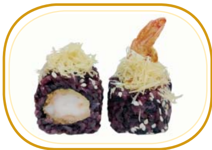
139. BLACK EBITEN €10,00 (riso venere alghe, gamberi* in tempura maionese, sesamo, kataifi, salsa teriyaki)