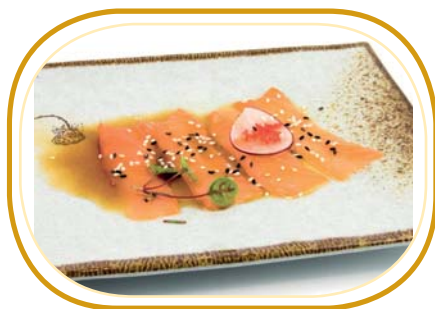
7. CARPACCIO SALMONE €3,00 (salmone,sesamo e salsa ponzu)