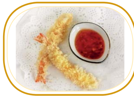
226. EBI TEMPURA (2pz) €4,00 (gamberi* fritti)