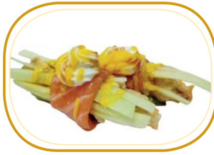
25. INVOLTINI HIMAWARI €5,00 (fiore di zucca fritto, cetriolo, avocado, avvolti salmone, philadelphia, salsa mango e salsa teriyaki)