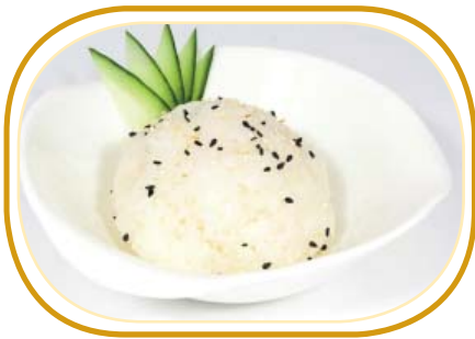
173. RISO BIANCO €2,00