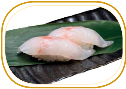
42. NIGIRI BRANZINO €3,00