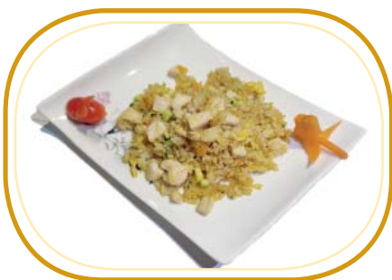
176. RISO AL CURRY €5,50 (riso saltato, curry, cipolla, pollo, uova, verdure)