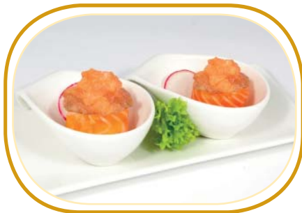
66. GUNKAN SPICY SALMONE €4,00 (pochi riso aceto, avvolti salmone, guarniti con salmone, salsa spicy)