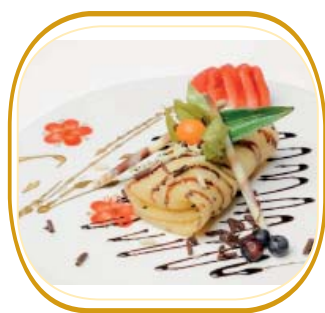
CREPES CON GELATO/NUTELLA (farina,uova,latte,sesamo,con gelato o nuttella e topping a scelta) € 4,50