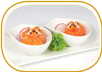
63. GUNKAN SALMONE €4,00 (pochi riso aceto, avvolti con salmone, guarniti con salmone, sesamo)