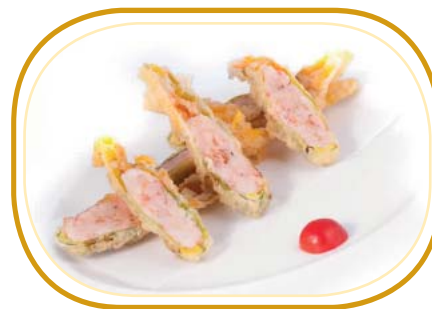
231. FIORI DI ZUCCA (pz4)€8,50 (ripieno tartar di polpa di granchio* e gamberi* fritti)