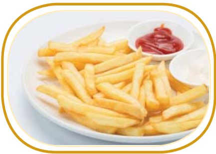
225. PATATE FRITTE* €4,00