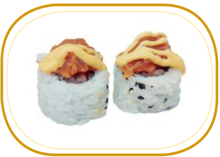
95. SPICY TUNA €10,00 (riso aceto, alghe, tonno, esterno tartare di tonno speziato con salsa spicy, sesamo)