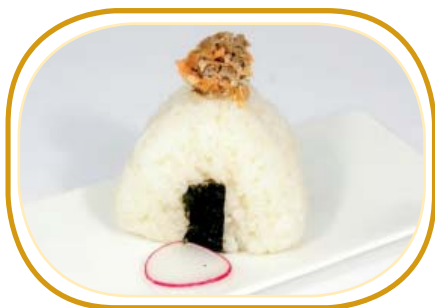
54. ONIGIRI MIURA €4,50 (salmone grigliato, kataifi, salsa teriyaki)