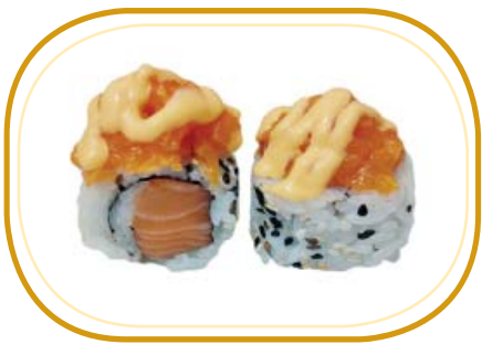
94. SPICY SALMONE €9,00 (riso aceto, alghe, salmone, esterno tartare di salmone speziato con salsa spicy, sesamo)