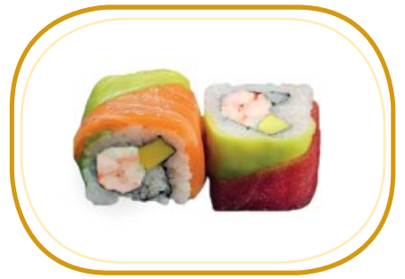
132. RAINBOW ROLL €12,00 (riso aceto, alghe, gambero* cotto, philadelphia, avocado, pesce misto esterno, salsa teriyaki, sesamo)