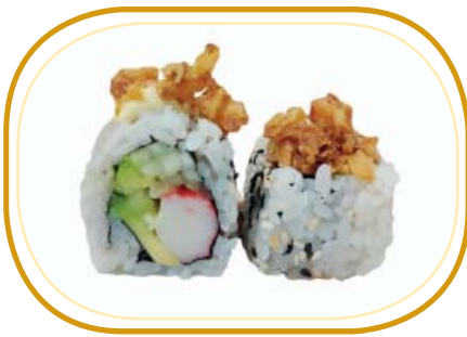
101. CRUSH SURIMI* ROLL €8,00 (riso aceto, alghe, polpa di granchio*, cetriolo, avocado, cipolla frita esterno, salsa teriyaki, maionese, sesamo)