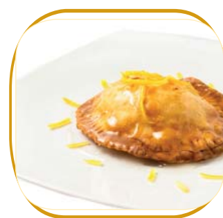
SEADAS AL MIELE €5,00