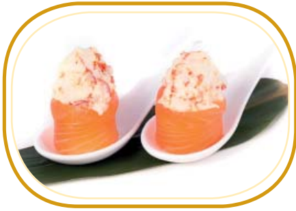
57. GUNKAN EBI SURIMI €4,00 (pochi riso aceto, avvolti salmone, guarniti con gamberi* cotti e polpa di granchio*)