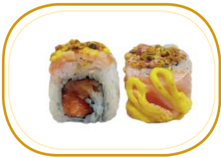
124. FLAMBÉ ROLL €12,00 (riso aceto, alghe, tartare di salmone speziato, salmone scottato esterno, salsa flambé, pistacchio, sesamo)