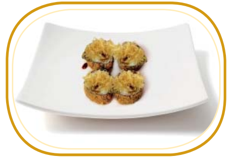
146. FUTO FRITTO (4pz) €6,00 (riso aceto alghe, salmone, surimi*, insalata philadelphia, tobiko, esterno kataifi, salsa teriyaki)