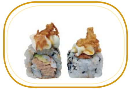
129. CRUSH COTTO €12,00 (crema di tonno cotto, avocado, philadelphia, gambero* cotto, cipolla frita esterno, salsa teriyaki, sesamo)