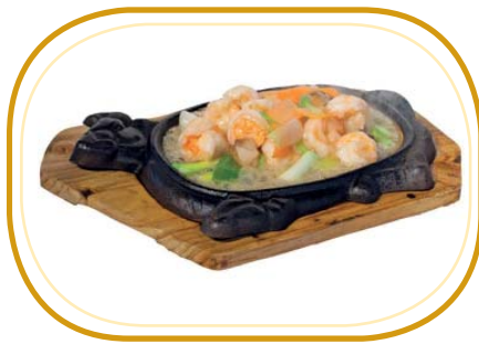
197. GAMBERETTI* ALLA PIASTRA €7,50 (gamberetti alla piastra con verdure e salsa soia)