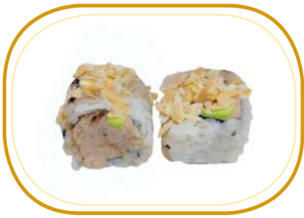
130. MANDORLE ROLL €12,00 (riso aceto, alghe, tonno cotto, maionese avocado, mandorle esterno, salsa teriyaki, sesamo)