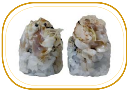
133. WHITY ROLL €12,00 (riso aceto, alghe, avocado, cetriolo, esterno tartare di branzino scottato, sesamo, cipollotti, kataifi, salsa teriyaki, sesamo)