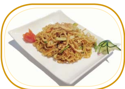
182. SPAGHETTI CON POLLO €5,50 (spaghetti con pollo, verdure, uova)