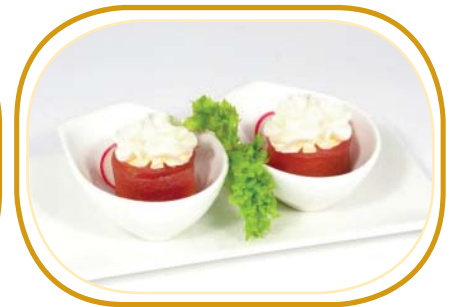
62. GUNKAN TONNO PHILADELPHIA €5,00 (pochi riso aceto, avvolti tonno, guarniti con philadelphia)