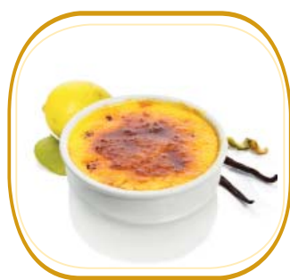
CREMA CATALANA € 5,00