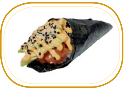
75. SPICY SALMONE TEMAKI €4,00 (riso aceto, alghe, cubetti salmone, avocado, sesamo, salsa spicy)