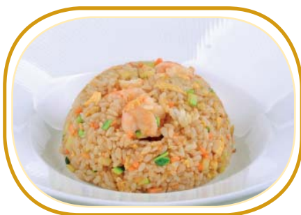
177. RISO CON GAMBERI €6,00 (riso saltato, gambero, piselli, uova)