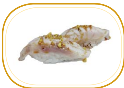
52. NIGIRI BRANZINO FLAMBÉ €5,00 (riso aceto, branzino scottato, salsa teriyaki e pistacchio)