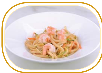
187. YAKI UDON €7,00 (spaghetti udon saltato, gamberi*, verdure, uova)