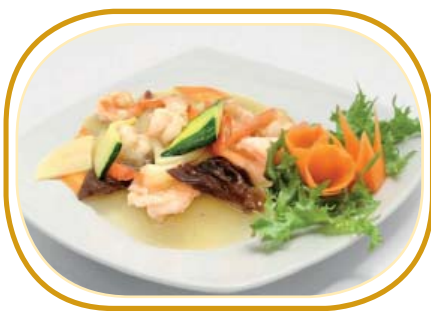
200. GAMBERI* CON VERDURE €7,50 (gamberi, verdure misti, bambù)