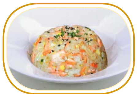
178. RISO SALTATO CON SALMONE €6,50 (riso saltato, salmone, uova, verdure, salsa di soia)