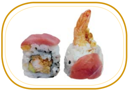
117. TUNA SHRIMP €12,00 (riso aceto, alghe, gambero* fritto, avocado, maionese, tonno esterno, sesamo)