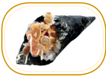
77. TEMAKI MANDORLA €5,00 (riso aceto, alghe, salmone cotto, philadelphia, avocado, mandorle, salsa teriyaki, sesamo)