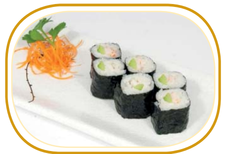
84. HOSOMAKI EBI €3,00 (riso aceto alghe,gamberi* cotti,avocado)