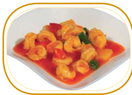
201. GAMBERI* AGRODOLCE €7,50 (gamberi, pomodoro, ananas, salsa agrodolce)