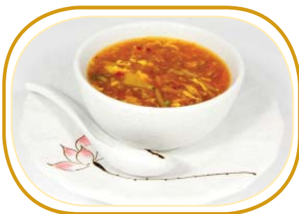
168. ZUPPA AGROPICCANTE €4,50 (carne maiale,verdure,uova,funghi,peperoncino, aceto)