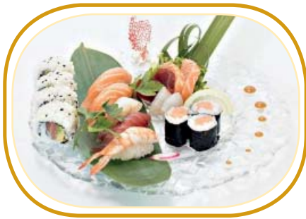
149. SUSHI SASHIMI €15,00 (nigiri 4pz, hosomaki 6pz, sashimi 9pz)