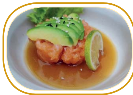
14. TARTARE SALMONE AVOCADO €6,00 (cubetti salmone, avocado, sesamo e salsa ponzu)