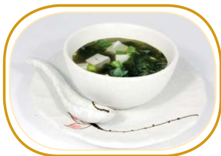
167. ZUPPA DI MISO €3,00 (zuppa a base di farina soia con alghe wakame e cubetti di toufu)