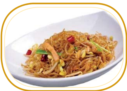
185. SPAGHETTI DI SOIA PICCANTE €5,90 (spaghetti di soia, verdure, pollo, uova, salsa piccante)