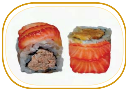
136. FRUIT ROLL €10,00 (riso aceto, alghe, salmone grigliato, frutta stagione esterno, philadelphia, salsa teriyaki, sesamo)