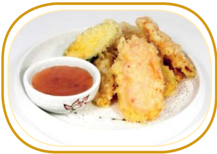
228. TEMPURA VERDURE €6,00 (verdure miste fritti)