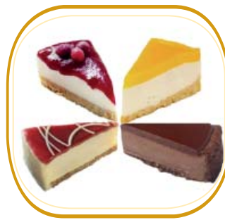
CHEESECAKE (frutti di bosco / panna cotta lampo- ne / mango albicocca / cioccolato) € 4,50