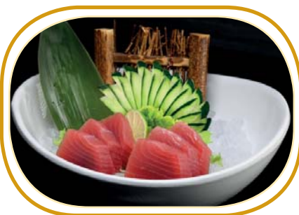
2. TONNO SASHIMI(6pz)€7,00