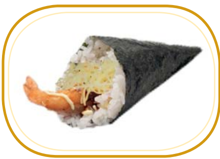
78. EBITEN TEMAKI €5,00 (riso aceto, alghe, gambero* fritto, avocado, kataifi, sesamo, salsa teriyaki)