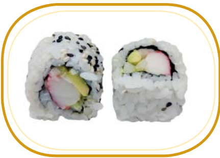
104. CALIFORNIA ROLL €8,00 (riso aceto, alghe, polpa di granchio*, cetriolo, avocado, maionese, sesamo)