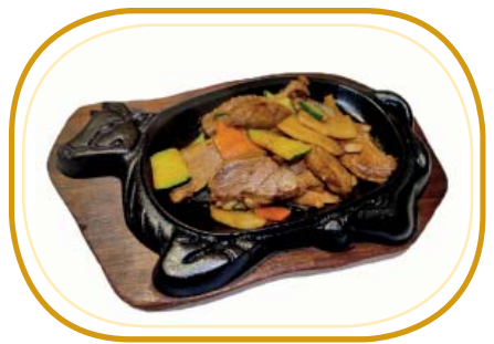
196. ANATRA ALLA PIASTRA €7,00 (anatra alla piastra con salsa soia)