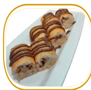
SUSHI BANANA (6pz) (riso aceto,foglio di soia,banana,nu- tella, topping cioccolato) € 4,50