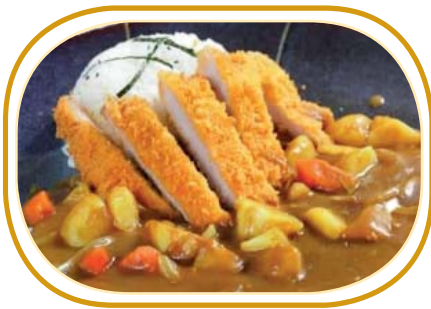
180. RISO POLLO CURRY €8,00 (riso bianco, pollo impanato, carota, cipolla, patata, - salsa curry)