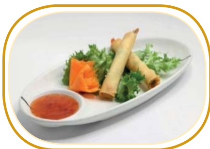
156. HARUMAKI EBI (2pz) €3,00 (involtini di gamberi*)