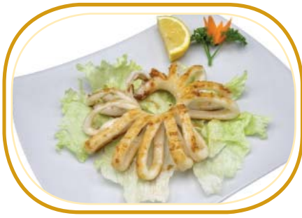
223. CALAMARO* ALLA GRIGLIA €7,00