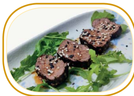
23. MANZO TATAKI (4pz) €5,00 (manzo appena scottato con sesamo, salsa teriyaki)