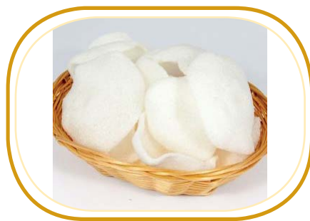
154. NUVOLE DI DRAGO €2,50 (chips di gamberi)