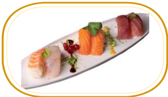
48. NIGIRI MISTO (6pz) €8,00