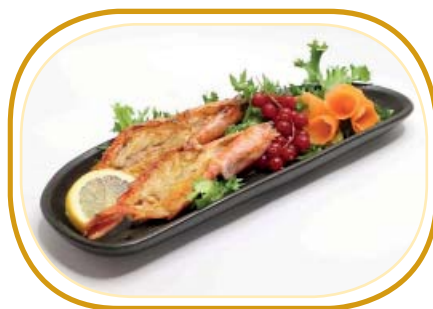
221. GAMBERONI* ALLA GRIGLIA €5,00