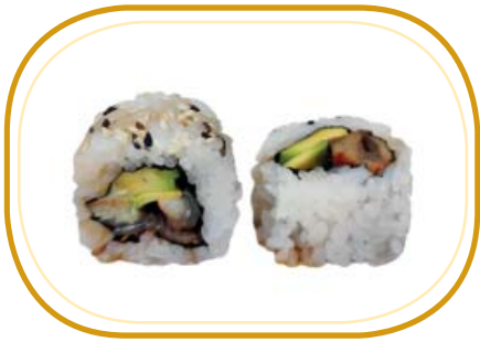
127. ANGUILLA ROLL €12,00 (riso aceto, alghe, anguilla*, avocado, maionese, sesamo, salsa teriyaki)