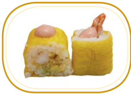
89. FUTO EBITEN €9,00 (riso aceto, foglia di soia, gambero* fritto, avocado, philadelphia, salsa fragola)