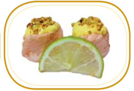
59. GUNKAN FLAMBÉ €5,00 (pochi riso aceto, avvolti salmone scottato guarniti con flambé e pistacchio)