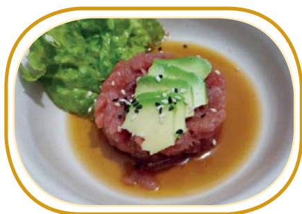
15. TARTARE TONNO AVOCADO €8,00 (cubetti tonno, avocado, sesamo e salsa ponzu)