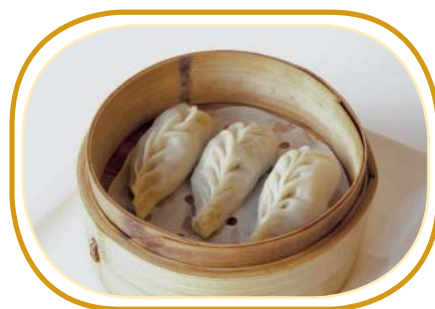
160. GYOZA* YASAI €4,00 (ravioli al vapore con verdure,spaghetti di soia,funghi cinese)