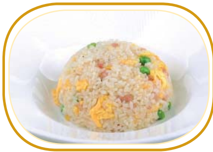
174. RISO CANTONESE €5,50 (riso saltato, prosciutto, piselli, uova)