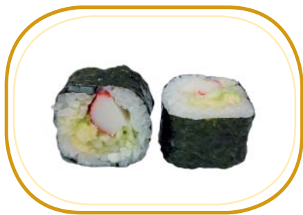
92. FUTOMAKI CALIFORNIA €8,00 (riso aceto, alghe, cetriolo, avocado, polpa di granchio*, maionese)