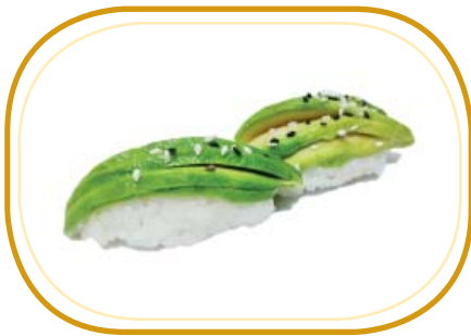
39. NIGIRI AVOCADO €3,00