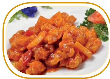
213. MAIALE AGRODOLCE €6,50 (maiale fritto, pomodoro, ananas, salsa agrodolce)