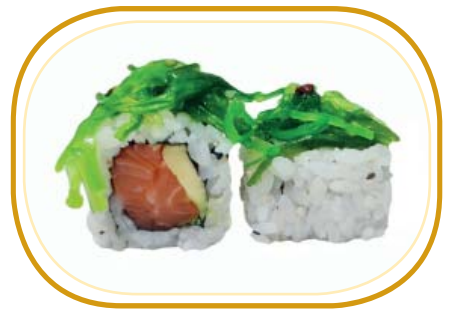
102. SALMONE WAKAME* €9,00 (salmone, avocado, sesamo, wakame esterno)