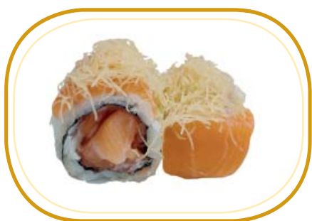
110. SAKE KATAIFI €10,00 (riso aceto, alghe, tartare di salmone, salmone esterno, kataifi, sesamo)