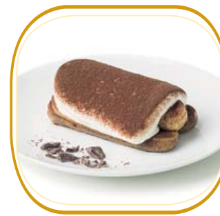
TIRAMISU' € 5,00