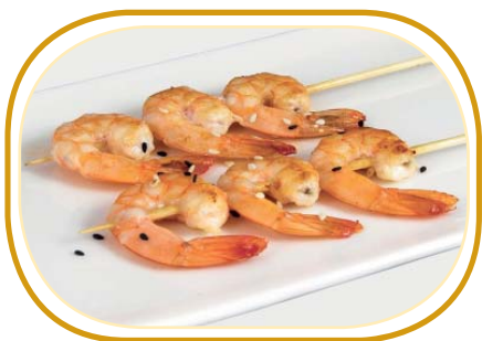
219. SPIEDINI DI GAMBERI* €4,00