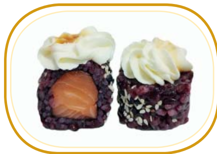
140. BLACK PHILADELPHIA €10,00 (riso venere alghe, salmone, philadelphia, sesamo, - salsa teriyaki)