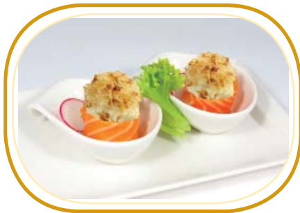
60. GUNKAN KATAIFI €5,00 (pochi riso aceto, avvolti salmone, guarniti con philadelphia, kataifi)