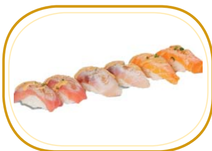
53. NIGIRI FLAMBÉ MISTO (6pz) €13,00