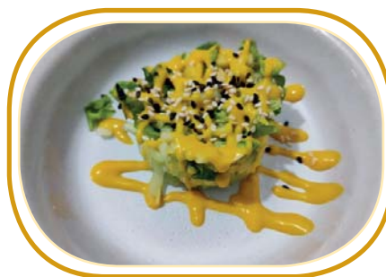
20. TARTARE INSALATA €4,00 (insalata, cetriolo, avocado, mango, sesamo e salsa mango)