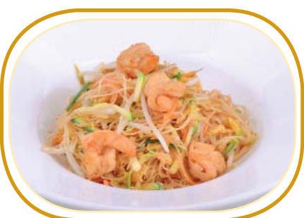
183. SPAGHETTI DI RISO €5,90 (spaghetti di riso, verdure, gamberi*, uova)