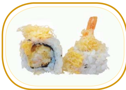
107. SPICY EBITEN €10,00 (riso aceto, alghe, gambero* fritto maionese, kataifi, sesamo, salsa spicy)