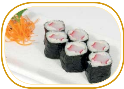
85. HOSOMAKI SURIMI* €3,00 (riso aceto alghe,polpa di granchio)