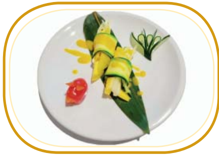
24. INVOLTINI VEGANO €4,00 (mango, cetrioli, avvolti zuccina, salsa mango)