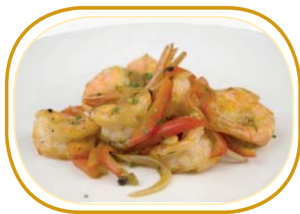
199. GAMBERI* SALE PEPE €7,50 (gamberi, cipolla, peperoncino)