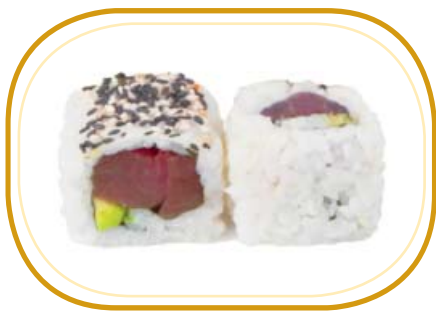
97. TONNO AVOCADO €10,00 (riso aceto, alghe, tonno, avocado, sesamo)