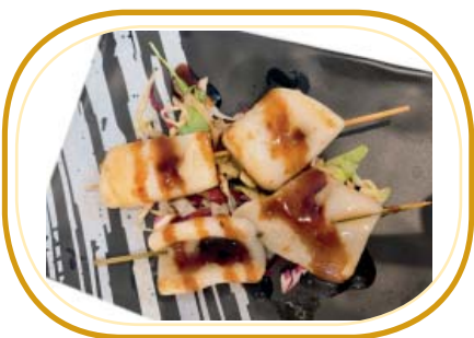
220. SPIEDINI DI CALAMARI* €4,00