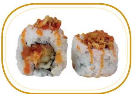
114. MEXICO €10,00 (riso aceto, alghe, tartare di salmone, cetrioli, nachos esterno, salsa sriracha, sesamo)