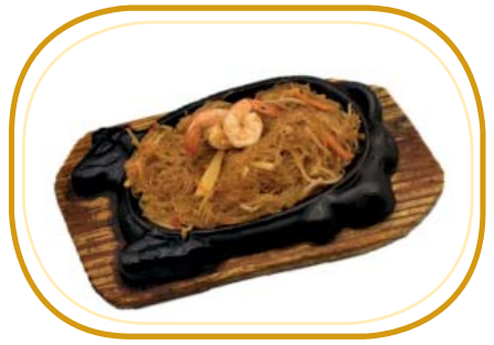
193. SPAGHETTI DI SOIA ALLA PIASTRA €6,90 (spaghetti di soia, frutti di mare*, verdure, uova)