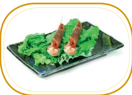
5. GAMBERO ROSSO* (2pz) €4,00