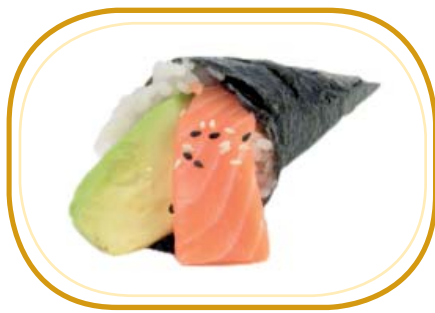
71. SALMONE TEMAKI €4,00 (riso aceto alghe, salmone, avocado, sesamo)