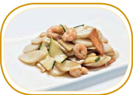
186. GNOCCHI DI RISO €6,50 (gnocchi di riso, verdure, gamberi*)