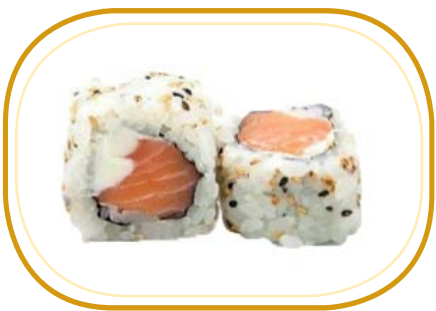
98. PHILADELPHIA ROLL €10,00 (riso aceto, alghe, salmone, philadelphia, sesamo, salsa teriyaki)