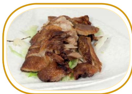
215. ANATRA ARROSTO €7,00 (coscia di anatra arrosto)