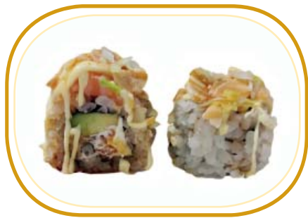
115. ALMOND €12,00 (riso aceto, alghe, tartare di salmone, avocado philadelphia, salmone esterno, erba cipollina, mandorle, maionese e salsa teriyaki, sesamo)