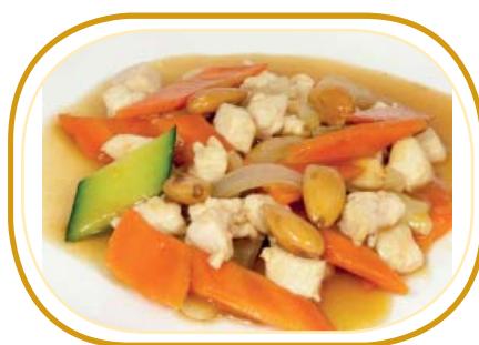
204. POLLO CON MANDORLE €6,50 (pollo, mandorle, verdure)