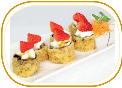
145. HOSSO FRUIT FRITTO (6pz) €6,00 (riso aceto, alghe, salmone, frutta stagione esterno, philadelphia)