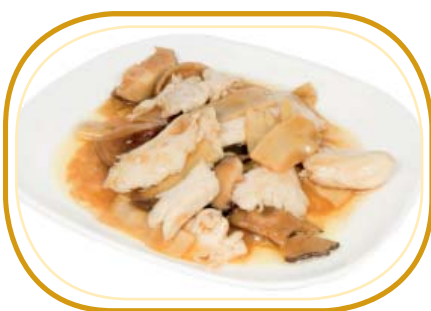
209. POLLO CON BAMBÙ E FUNGHI €6,50 (pollo, bambù, funghi)