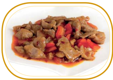
211. MANZO PICCANTE €6,50 (manzo, cipolla, peperone, salsa piccante)