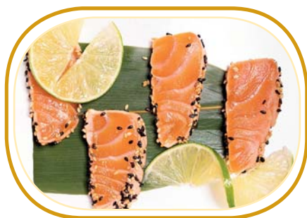
21. SALMONE TATAKI €4,00 (salmone appena scottato con sesamo, salsa teriyaki)