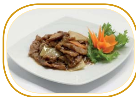
210. MANZO CON BAMBÙ E FUNGHI €6,50 (manzo, bambù, funghi)