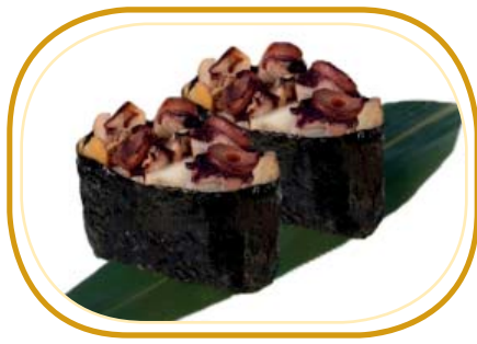
69. GUNKAN POLPO* €4,00 (pochi riso aceto, avvolti alghe, guarniti con polpo, salsa teriyaki)