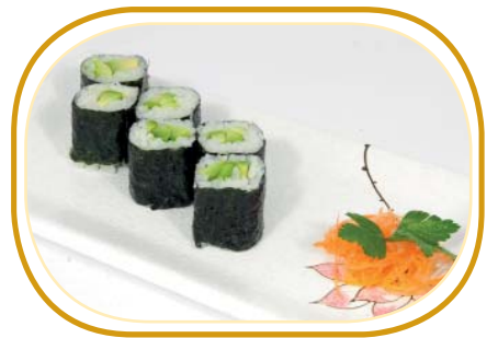
87. HOSOMAKI AVOCADO €3,00 (riso aceto alghe,avocado)