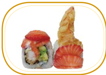
137. RED SWEET ROLL €12,00 (riso aceto, alghe, gambero* fritto, avocado, maionese, frutta stagione, philadelphia, salsa fragola e salsa teriyaki, sesamo)