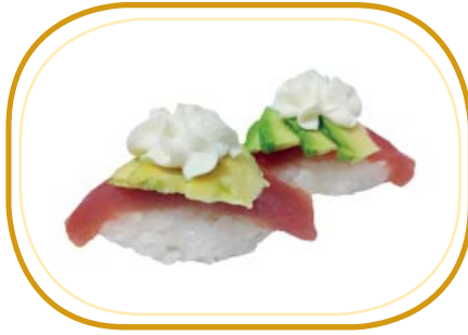
37. NIGIRI TONNO AVOCADO €5,00 (riso aceto,tonno,avocado,philadelphia)