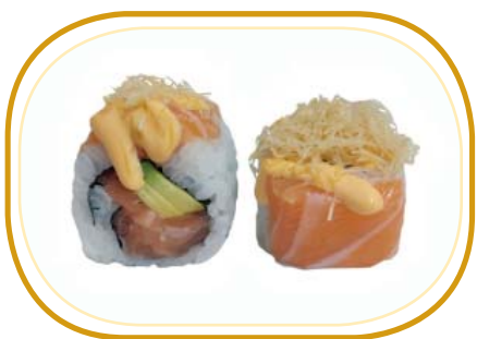
113. ORO €10,00 (riso aceto, alghe, tartare di salmone, avocado, salmone esterno, kataifi, salsa spicy, sesamo)