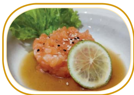
12. TARTARE SALMONE €6,00 (cubetti salmone, sesamo, salsa ponzu)