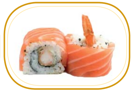
123. TIGER ROLL €12,00 (riso aceto, alghe, gambero* fritto, avocado, maionese, salmone esterno, salsa teriyaki, sesamo)