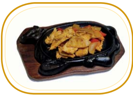
194. POLLO SALSA SATAY ALLA PIASTRA €6,50 (pollo, verdure, salsa satay)