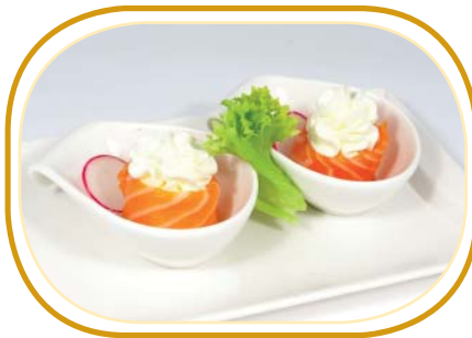
61. GUNKAN SALMONE PHILADELPHIA €4,00 (pochi riso aceto, avvolti salmone, guarniti con philadelphia)