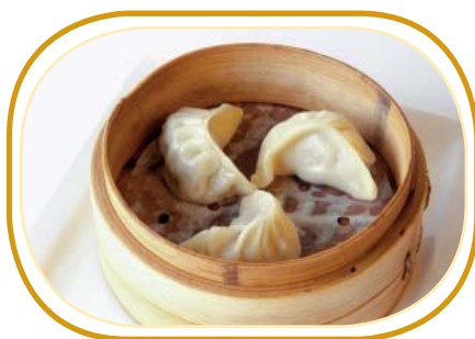
159. GYOZA* €4,00 (ravioli al vapore con carne di maiale,verdure)