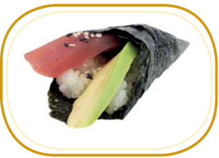
72. TONNO TEMAKI €5,00 (riso aceto alghe, tonno, avocado, sesamo)