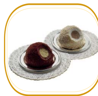
TARTUFO NERO O BIANCO € 4,50