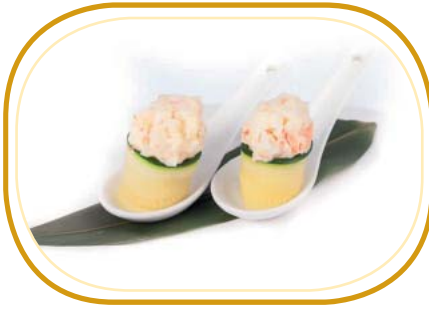
58. GUNKAN ZUCCHINA €5,00 (pochi riso aceto, avvolti zucchini, guarniti con gamberi* cotti e polpa di granchio*)