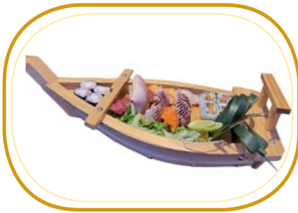
150. BARCA PICCOLO €20,00 (nigiri 4pz, hosomaki 4pz, uramaki 4pz, sashimi 9pz)