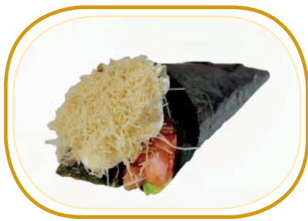
73. SALMONE KATAIFI TEMAKI €4,00 (riso aceto, alghe, tartare di salmone, avocado, philadelphia, sesamo, kataifi)