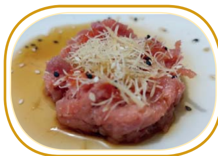
17. TARTARE TONNO SPICY KATAIFI €8,00 (cubetti tonno, sesamo, salsa ponzu, salsa sriracha, sopra kataifi)