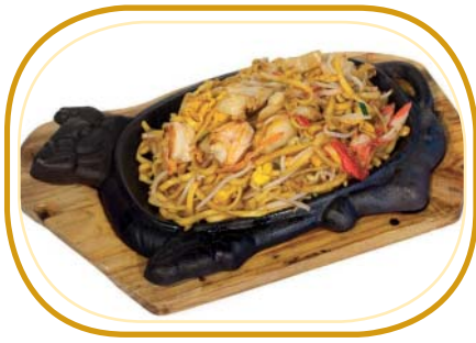
191. SPAGHETTI ALLA PIASTRA €6,50 (spaghetti, frutti di mare*, verdure, uova)