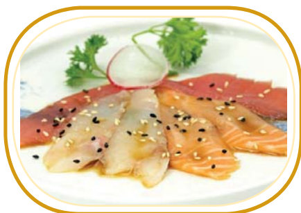
10. CARPACCIO MISTO €5,00 (pesce misto, sesamo e salsa ponzu)