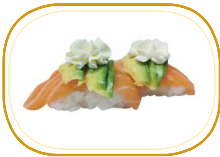
36. NIGIRI SALMONE AVOCADO €4,00 (riso aceto,salmone,avocado,philadelphia)