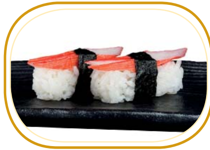
43. NIGIRI SURIMI* €3,00