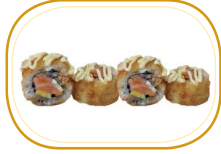
148. SPECIAL FRITTO (4pz) €6,00 (riso aceto, alghe, salmone, avocado, philadelphia, sesamo, salsa tonnata, salsa teriyaki)