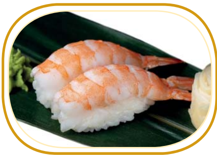
45. NIGIRI EBI (gambero cotta*) €3,00