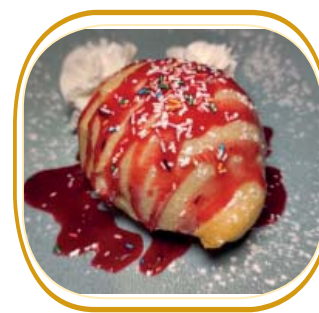
GELATO FRITTO (vaniglia o cioccolato con topping a scelta) € 4,00