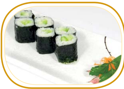
86. HOSOMAKI KAPPA €3,00 (riso aceto alghe, cetriolo)