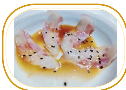
9. CARPACCIO BRANZINO €3,00 (branzino, sesamo e salsa ponzu)