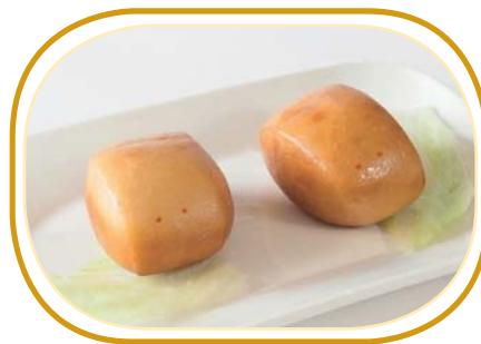
166. PANE* DOLCE AL FRITTO €3,00 (pane dolce al fritto,interno con la crema uova)