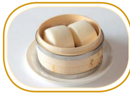
163. PANE* AL VAPORE €3,00