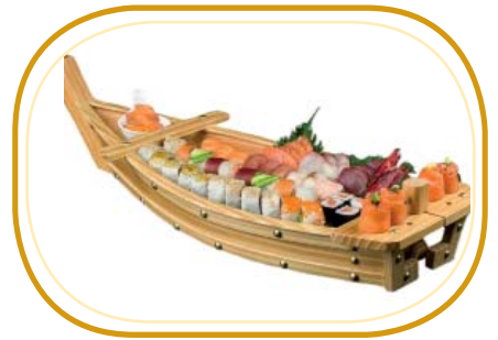
151. BARCA GRANDE €50,00 (nigiri 8pz, hosomaki 8pz, uramaki 8pz, futomaki 8pz, gunkan 2pz, sashimi 15pz)