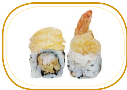
106. EBITEN €10,00 (riso aceto, alghe, gambero* fritto maionese, sesamo, kataifi, salsa teriyaki)