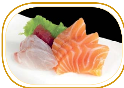
3. SASHIMI MIX PICCOLO (9pz) €10,00 (salmone,tonno,branzino)