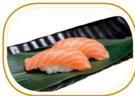
40. NIGIRI SALMONE €3,00