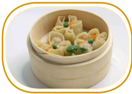
161. XIAOMAI* €4,50 (ravioli al vapore con gamberi*,carne di maiale)