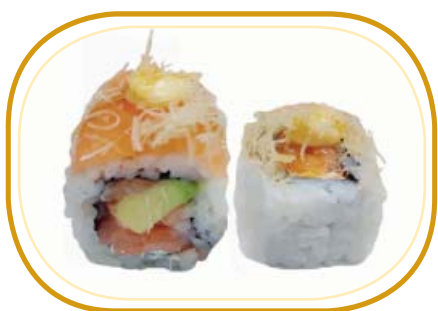
111. DYES €10,00 (riso aceto, alghe, tartare di salmone, avocado, philadelphia salmone esterno, maionese, salsa teriyaki, kataifi, sesamo)