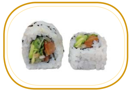
105. VEGANO ROLL €8,00 (riso aceto, alghe, avocado, cetriolo, insalata, pomodoro, sesamo)