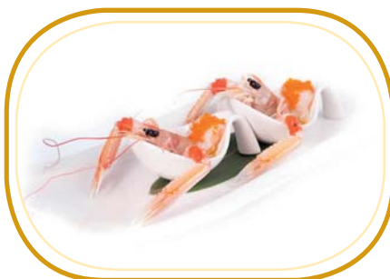
6. SCAMPI* (2pz) €4,00