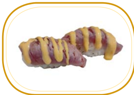
51. NIGIRI TONNO FLAMBÉ €5,50 (riso aceto, tonno scottato, salsa teriyaki, salsa spicy)