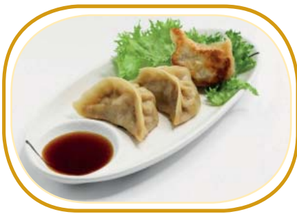
162. GYOZA* ALLA PIASTRA €4,50 (ravioli alla piastra con carne di maiale,verdure)