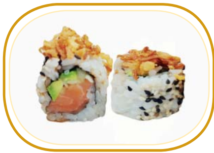
100. CRUSH SAKE ROLL €9,00 (riso aceto, alghe, salmone, avocado, cetriolo, cipolla frita esterno, salsa teriyaki, maionese, sesamo)