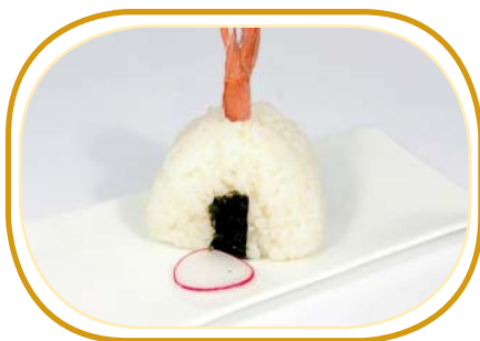
55. ONIGIRI EBITEN €4,50 (gamberi* in tempura, kataifi, salsa teriyaki)