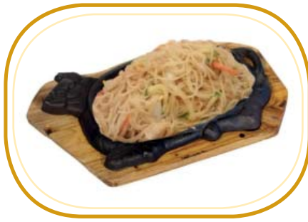
192. SPAGHETTI DI RISO ALLA PIASTRA €6,90 (spaghetti di riso, frutti di mare*, verdure, uova)