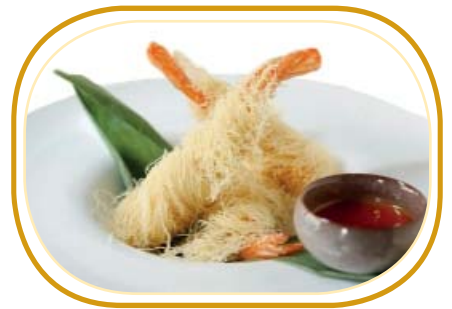
227. EBI KATAIFI (2pz) €5,00 (kataifi,gamberi* fritti)