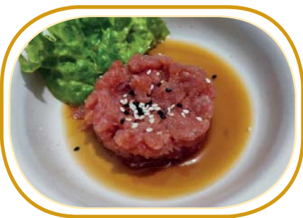
13. TARTARE TONNO €8,00 (cubetti tonno, sesamo, salsa ponzu)