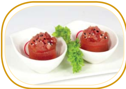
64. GUNKAN TONNO €5,00 (pochi riso aceto, avvolti con tonno, guarniti con tonno, sesamo)