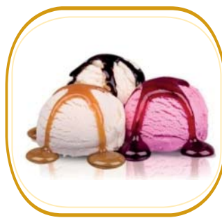
GELATO (vari gusti con topping a scelta) € 3,50