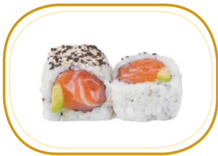
96. SALMONE AVOCADO €9,00 (riso aceto, alghe, salmone, avocado, sesamo)