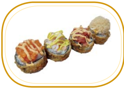
147. SPECIAL FUTO FRITTO (4pz) €8,00 (riso aceto, alghe, salmone, carota giallo, kataifi esterno uno di spicy tonno, uno di spicy salmone, uno di philadelphia e gambero cotto, uno di philadelphia e mango)