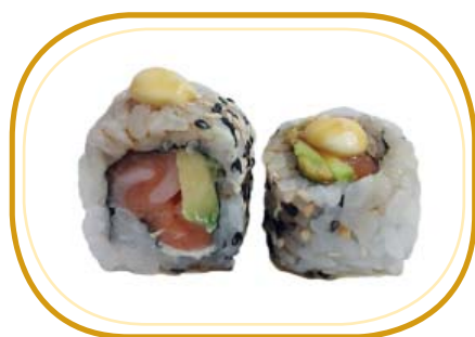
109. SAKE TONNATA €10,00 (riso aceto, alghe, salmone, avocado, philadelphia, salsa tonnata, salsa teriyaki, sesamo)