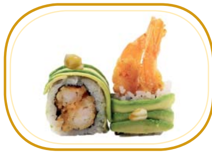
122. DRAGON ROLL €12,00 (riso aceto, alghe, gambero* fritto, philadelphia, avocado esterno, salsa tonnata, salsa teriyaki, sesamo)