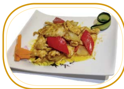
207. POLLO CURRY €6,50 (pollo con curry, cipolla, peperone)