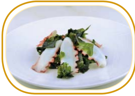
171. TAKO SU €5,00 (alghe wakame essiccati, polpo*, salsa carpaccio, sesamo)