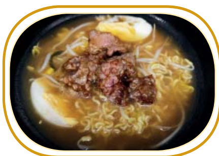
189. RAMEN CON MANZO €8,00 (ramen con brodo, manzo, verdure, uova)