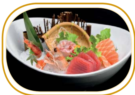
4. SASHIMI MIX GRANDE (15pz) €16,00 (salmone,tonno,branzino,gambero rosso *,scampi*)