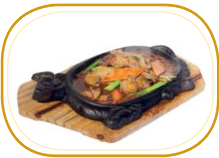
195. MANZO ALLA PIASTRA €6,50 (manzo alla piastra, verdure, salsa di soia)