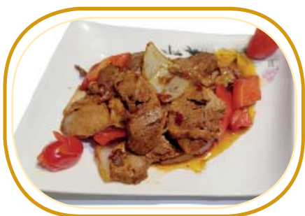
214. ANATRA PICCANTE €7,00 (anatra, cipolla, peperone, salsa piccante)