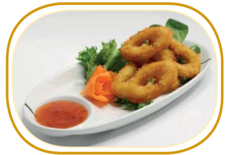
230. TEMPURA CALAMARI* €7,00 (calamari impanati fritti)