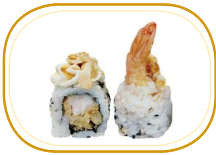
121. EBITEN MANDORLE ROLL €12,00 (riso aceto, alghe, gambero* fritto, philadelphia, mandorle esterno, salsa teriyaki, sesamo)