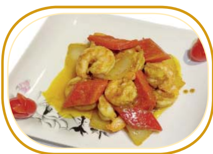
203. GAMBERI* CURRY €7,50 (gamberi, cipolla, peperone, salsa curry)