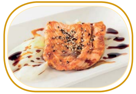
224. SALMONE ALLA GRIGLIA €8,00