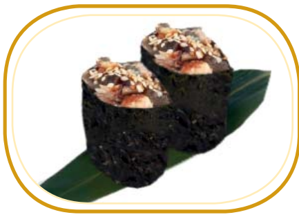
70. GUNKAN ANGUILLA* €5,00 (pochi riso aceto, avvolti alghe, guarniti con anguilla, salsa teriyaki)