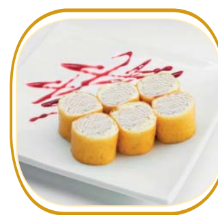
SUSHI GELATO (6pz) (foglio di soia con gelato alla vaniglia o al cioccolato, topping a scelta) € 4,50