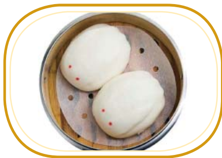
164. PANE* DOLCE AL VAPORE €3,00 (pane dolce al vapore,interno con la crema uova)