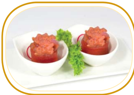
67. GUNKAN SPICY TONNO €5,00 (pochi riso aceto, avvolti tonno, guarniti con tonno, salsa spicy)