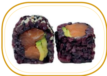
141. BLACK SALMONE AVOCADO €9,00 (riso venere alghe, salmone, avocado, sesamo)