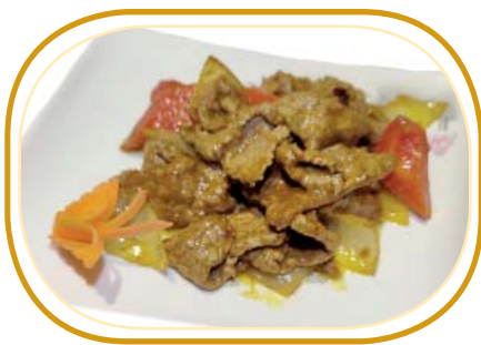
212. MANZO CURRY €6,50 (manzo con curry, cipolla, peperone)