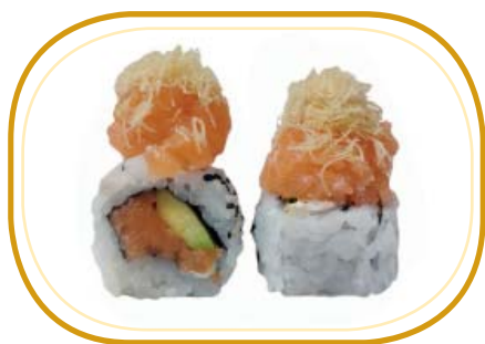
112. TOKYO €10,00 (riso aceto, alghe, tartare di salmone, avocado, philadelphia, tartare salmone esterno, kataifi, sesamo)