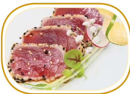
22. TONNO TATAKI €5,00 (tonno appena scottato con sesamo, salsa teriyaki)