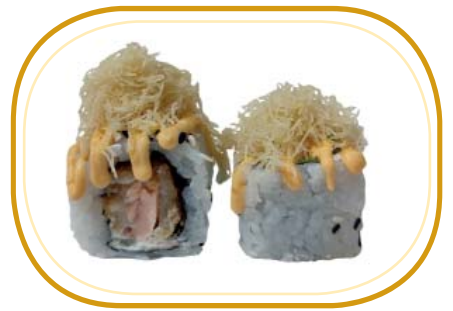
126. HOT SALMON €10,00 (riso aceto, alghe, salmone fritto, avocado, philadelphia, insalata, kataifi, salsa spicy, sesamo)