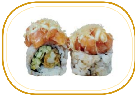
128. HIMAWARI ROLL €12,00 (riso aceto, alghe, fiore di zucca fritto, cetriolo, avocado, tartare di salmone esterno, sesamo, kataifi, salsa tonnata e salsa teriyaki)