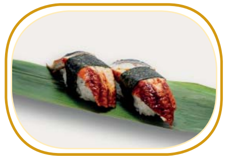
47. NIGIRI ANGUILLA* €5,00