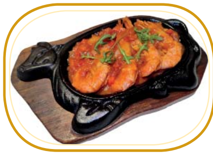
198. GAMBERONI* ALLA PIASTRA €8,00 (gamberoni alla piastra con verdure e polpa pomodori)