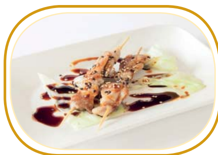
218. SPIEDINI DI POLLO €4,00