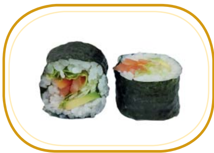
93. FUTOMAKI VEGANO €8,00 (riso aceto, alghe, insalata, avocado, cetriolo, pomodoro)