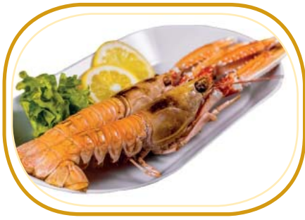
222. SCAMPI* ALLA GRIGLIA €5,00