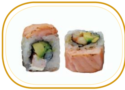
131. COTTO ROLL €12,00 (riso aceto, alghe, gambero* cotto, avocado, philadelphia, salmone scottato esterno, salsa teriyaki, sesamo)