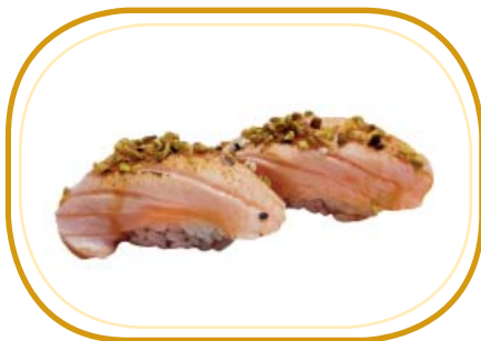
50. NIGIRI SALMONE FLAMBÉ €5,00 (riso aceto, salmone scottato, salsa teriyaki e pistacchio)