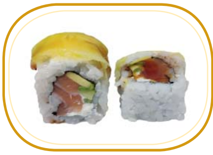
134. MANGO ROLL €12,00 (riso aceto, alghe, salmone, avocado, philadelphia, - mango esterno, salsa teriyaki, sesamo)