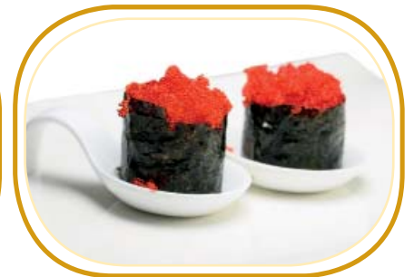
68. GUNKAN TOBIKO €4,00 (pochi riso aceto, avvolti alghe, guarniti con tobiko)