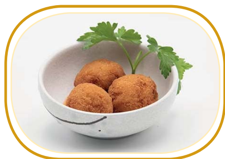
158. POLPETTINE DI GAMBERI (3pz) €5,00 (polpettine fritte con carne di maiale,pollo,gambero*, salsa teriyaki)